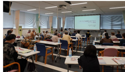
昨年の講義の様子

プログラム： 10:00-11:00 講義 11:00-11:40 測定 11:40-12:00 まとめ