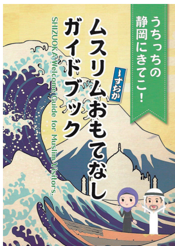
(図2) イスラーム圏を射程に入れてハラール食品開発を進める県内食品卸企業との共同研究の成果の一端として関係者に配布された「しずおかムスリムおもてなしガイドブック」。(富士農商事株式会社との共同研究による成果)